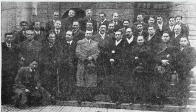
в. „Спорт“, 5 март 1937 г. Част от делегатите на ВСС при БНСФ, приели на 3 март 1937 г. Националната дивизия