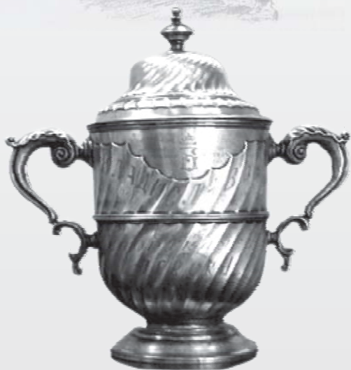
Царската купа, връчвана на държавния първенец до 1937 г.