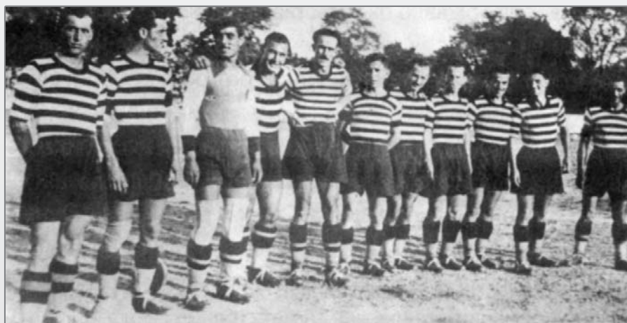
Тича Варна, държавен първенец за 1937/38 г.