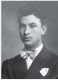
Лазар Попов председател на БНСФ през 1937 г.